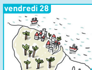
vendredi 28 C'est où, la Guyane ?