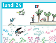
lundi 24 Les Outre-mer