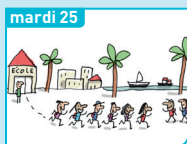
mardi 25 Vivre dans les Outre-mer