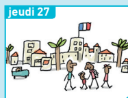
jeudi 27 C'est où, Mayotte ?