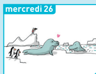
mercredi 26 Pourquoi les Outre-mer font rêver ?